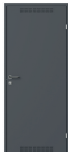
model 2 z wentylacją Antracyt (RAL 7024)

(skrzydło metalowe z zamkiem na wkładkę, ościeżnica metalowa kątowna, klamka z szyldem okrągłym i rozetą)