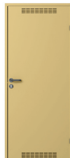
model 2 z wentylacją Kremowy (RAL 1001)