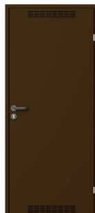
model 2 z wentylacją Brązowy (RAL 8028)