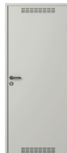
model 2 z wentylacją Popielaty (RAL 7047)