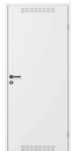
model 2 z wentylacją Biały (RAL 9016)

* Sugerowana cena detaliczna w zależności od opcji: model 1 „pełne” ocynkowane nielakierowane 289 netto 355,47 brutto, model 1 „pełne” lakierowane 340 netto 418,20 brutto, model 2 z wentylacją ocynkowane nielakierowane 299 netto 367,77 brutto, model 2 z wentylacją lakierowane 349 netto 429,27 brutto. Ceny podane w PLN. Firma Porta KMI Poland zastrzega sobie prawo wprowadzenia (bez uprzedzenia) zmian parametrów technicznych, wyposażenia, cen, warunków wydłużonej gwarancji oraz specyfikacji produktów.