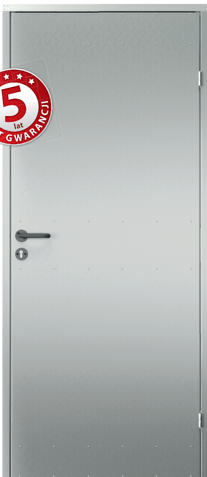
model 1 „pełne”, ocynkowane nielakierowane