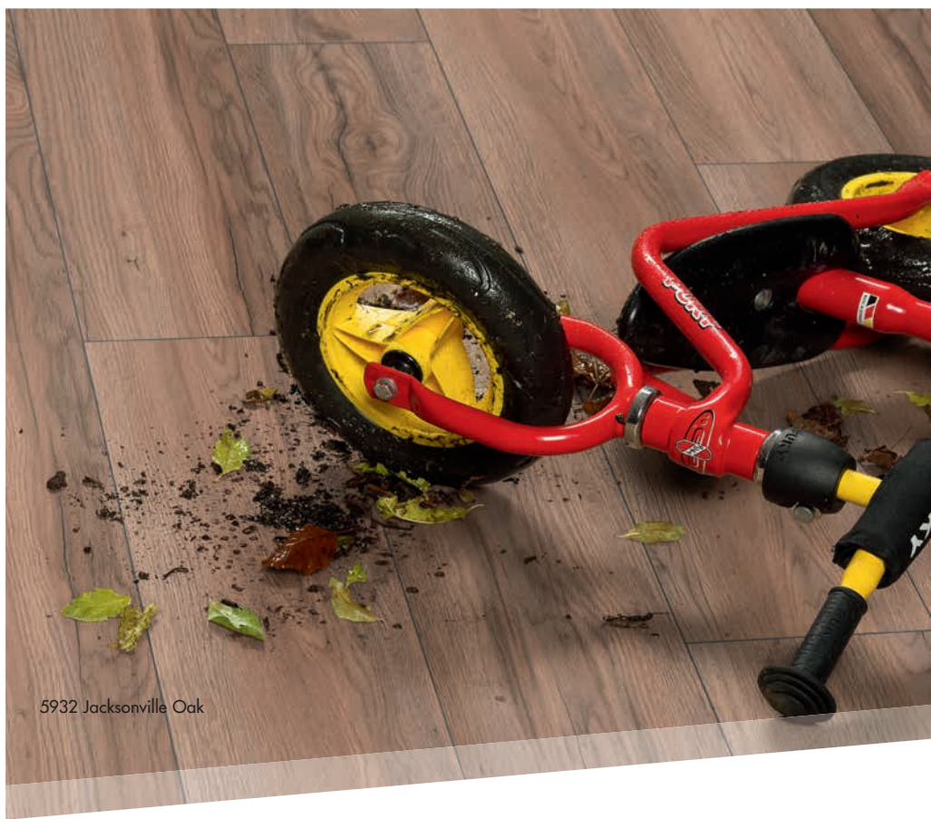
5932 Jacksonville Oak