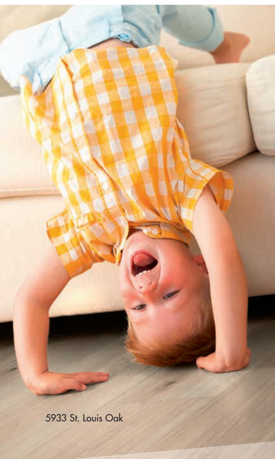
5933 St. Louis Oak

in Bädern. Die besonderen Anforderungen in Feuchträumen bewältigt er spielend - am Boden und an der Wand. Er ist wasserverträglich, rutschfest, quillt nicht auf und erfüllt dennoch alle funktionalen und ästhetischen Ansprüche des modernen Wohnens.